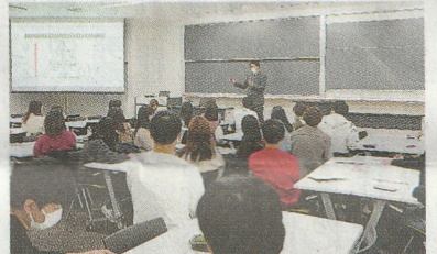
学生たちは熱心に聴講した

共感した人が岐阜市に転入する流れをつくり、20代の岐阜県内からの転入者と話した。不登校特別校の取り組みなども解説した。